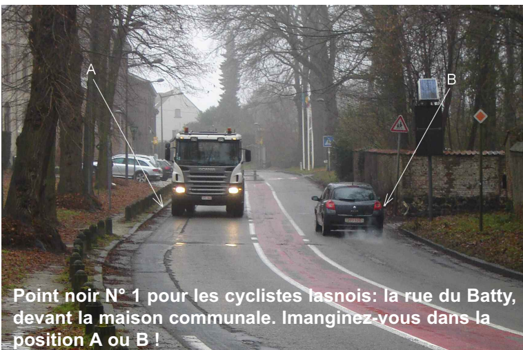
Point noir N° 1 pour les cyclistes lasnois: la rue du Batty, devant la maison communale. Imaginez-vous dans la position A ou B !

* Ministère de l'Équipement et des Transports